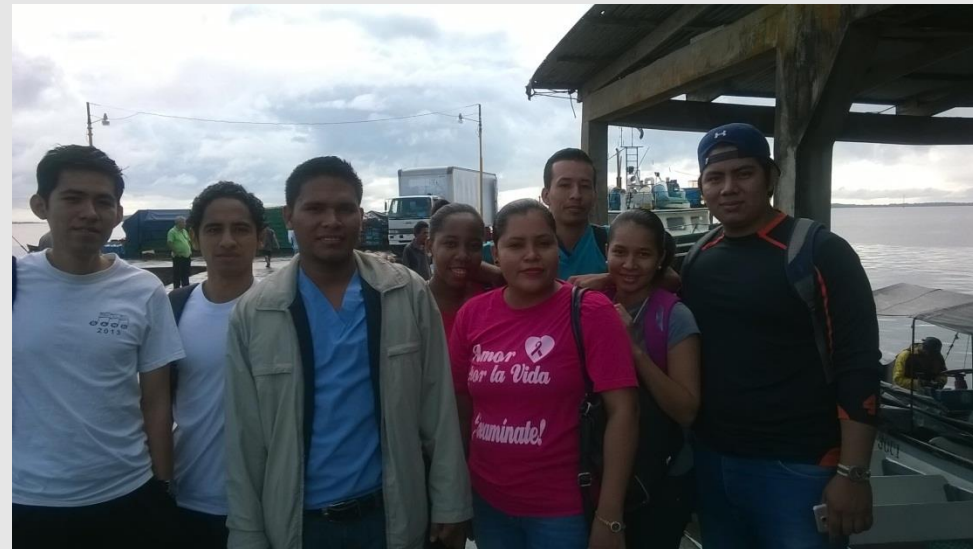
Alumnos de 6 to año antes de partir hacia las comunidades