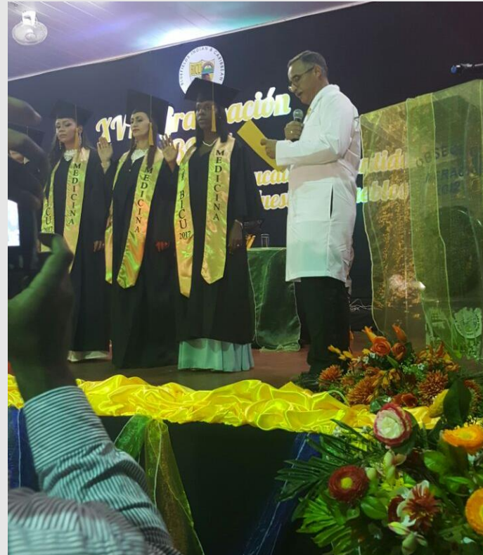
1 era graduación diciembre 2017